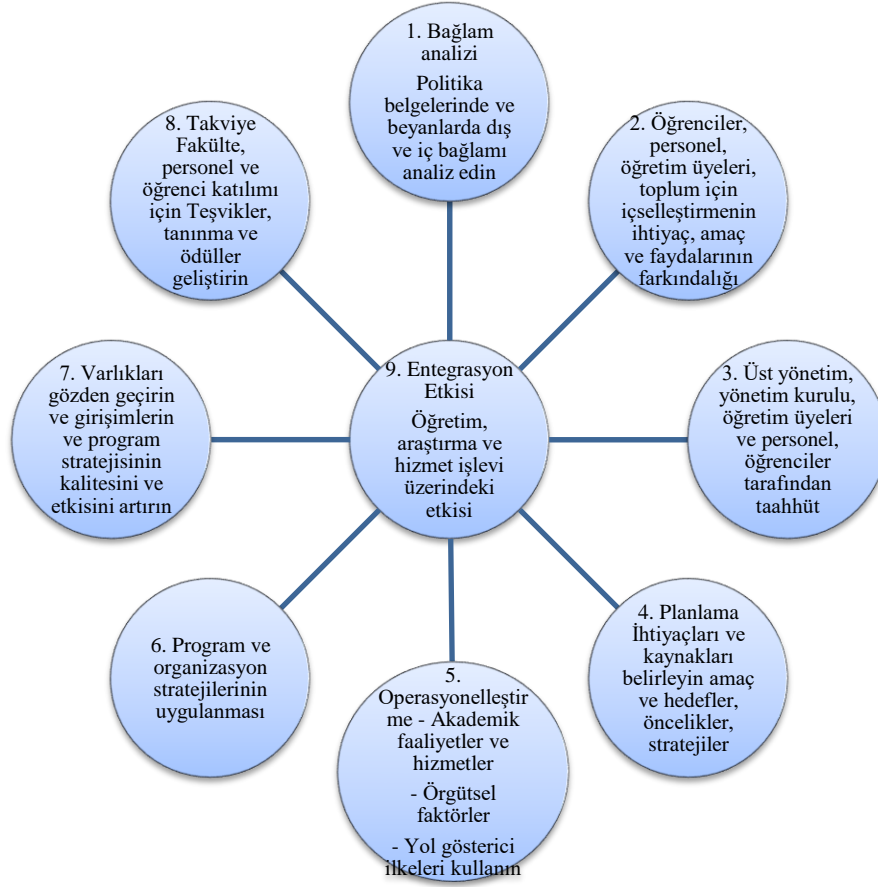
Şekil 2. Uluslararasılaşma Döngüsü Wit (2002)